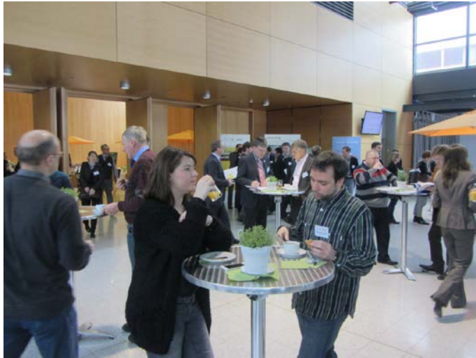
Networking beim Kongress Energieautonome Kommunen im Konferenzbereich der Messe Freiburg im Rahmen der GETEC